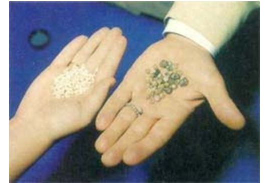
Diamantes en bruto

Como materias primas para las esencias se utilizan diferentes piedras preciosas, metales, minerales y plantas.